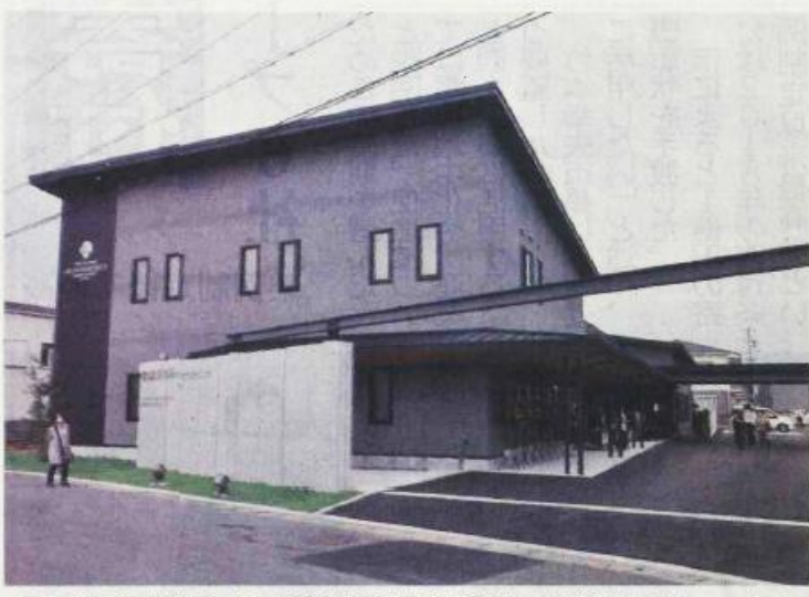
9月2日に開院する「豊川整形外科リハビリクリニック」 ＝豊川市下長山町で

「豊川整形外科リハビリクリニック」が9月2日、豊川市下長山町に開院する。骨粗しょう症の治療やリハビリに力を入れ、高齢者の健康寿命を